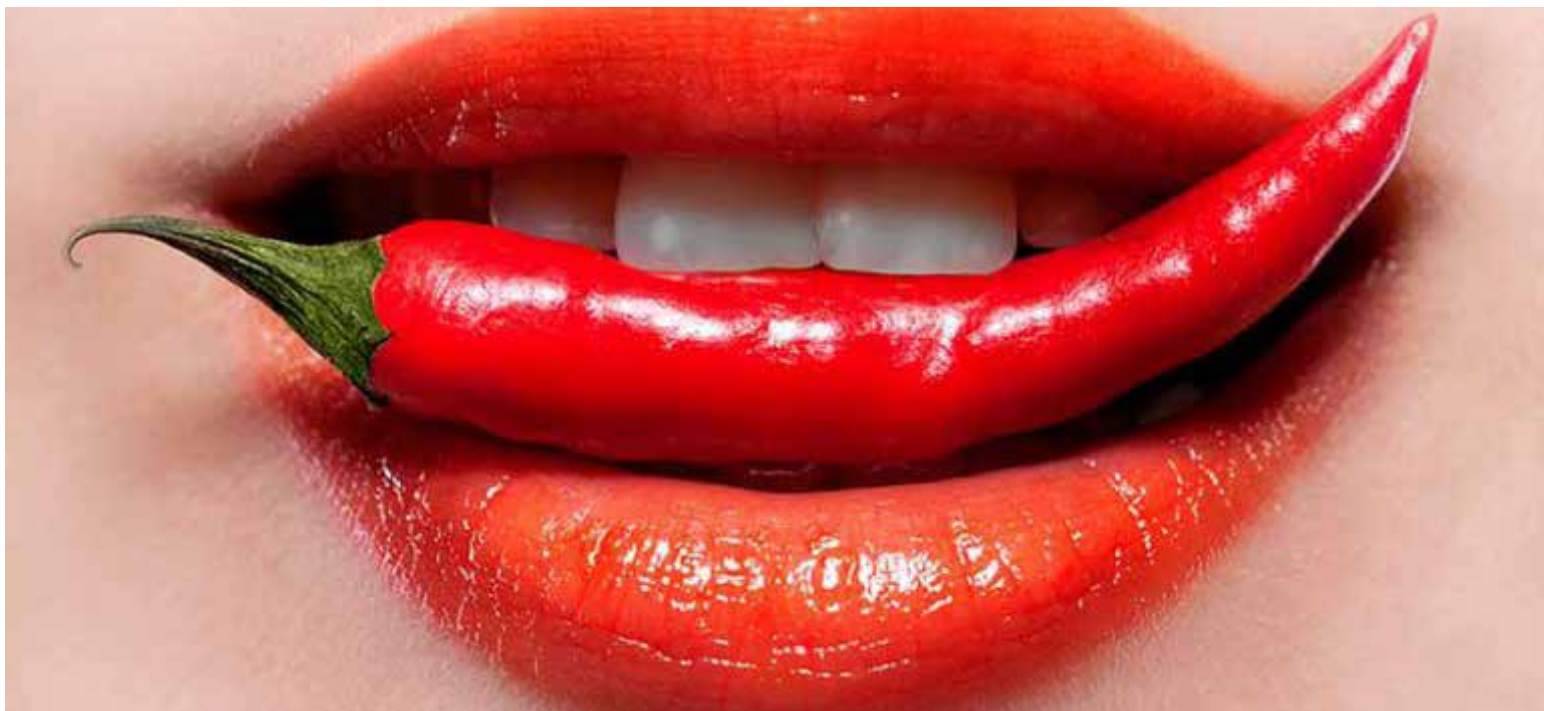
Una investigación manifestó que el consumo de pimientos rojos reduce la mortalidad en un 13% entre los participantes.

Para aprovechar al máximo sus bondades, simplemente agrega una variedad de chiles a tus platillos. ¡Tu salud podría agradecértelo con cada bocado!