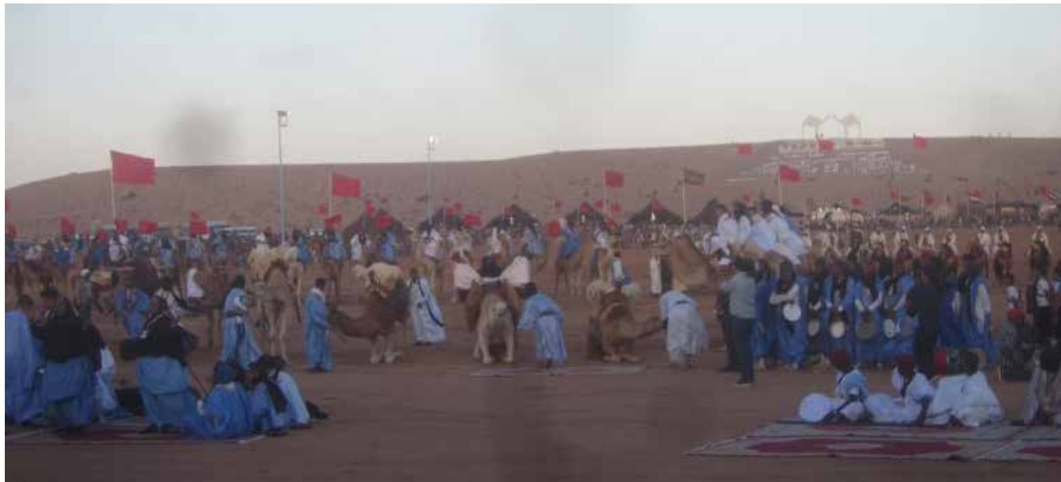
El Moussem de Tan-Tan, en el suroeste Marruecos, es un encuentro anual de pueblos nómadas del Sahara que agrupa a más de treinta tribus del sur de Marruecos y de otras partes de África del noroeste.