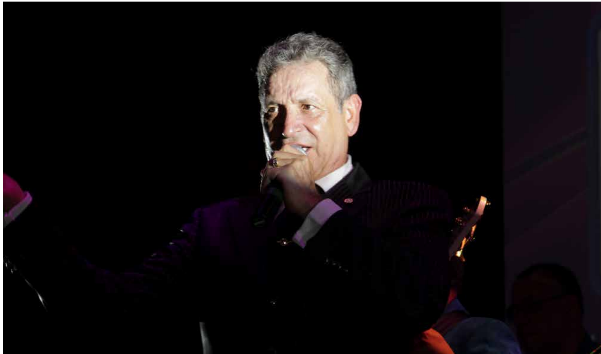
Darío Gómez el Rey del Despecho.

P rimicia Diario, en alguna ocasión estuvo hablando por horas con el Rey del Despecho, Darío Gómez. Para nuestros lectores conocerán algo desconocido de este artista que lleva más de 20 años en la cumbre de la fama.