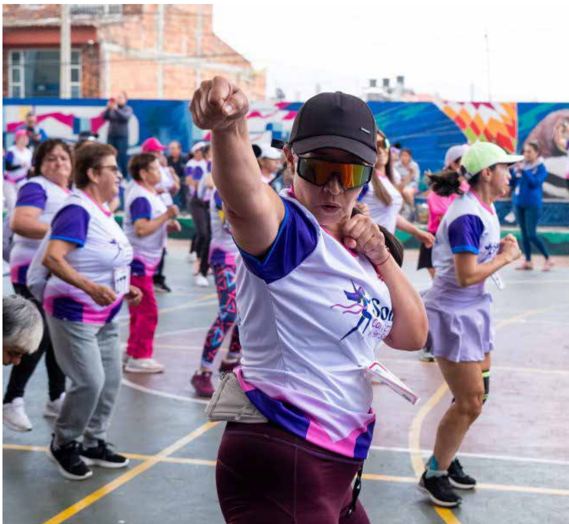
La iniciativa está diseñada para personas de todas las edades y busca integrar el movimiento en cada aspecto de la vida diaria

Para incentivar la participación, Indepor premiará la creatividad. Las primeras 20 personas que envíen videos originales mostrando su forma de activarse, graba-