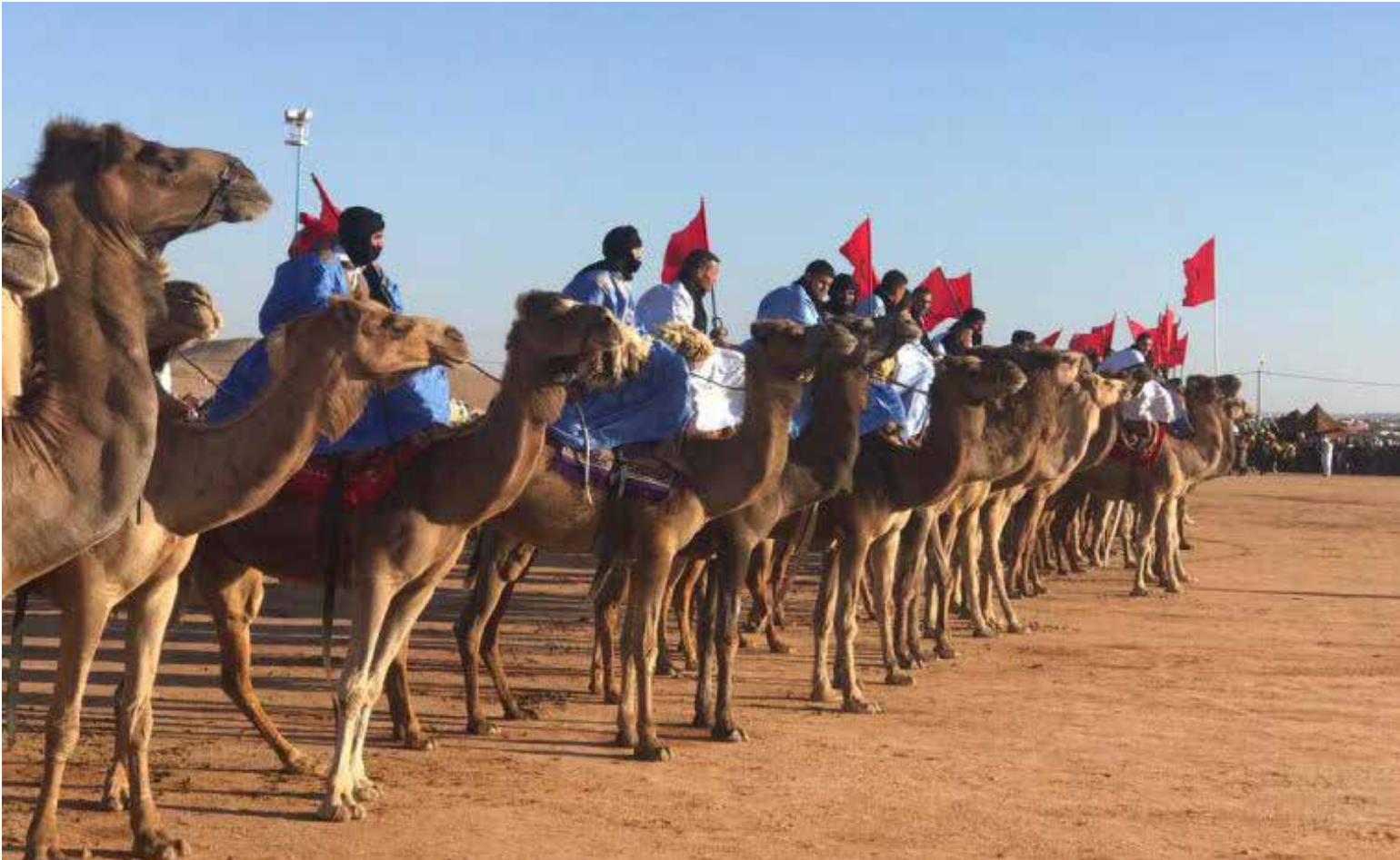
La fácil domesticación del dromedario, llamado «Ymel» en el Sahara Occidental, y su resistencia al desierto han hecho de este animal el compañero perfecto del beduino saharauí, al que provee de carne, leche y cuero.