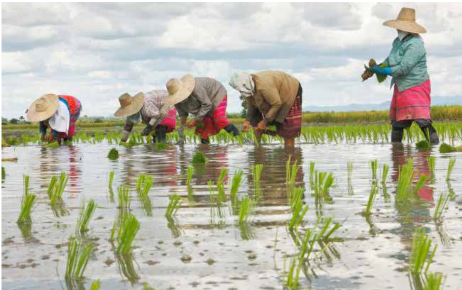
Pequeños productores de arroz

El Ministerio de Agricultura ha especificado que el apoyo se otorgará a la producción de arroz paddy verde cosechada entre el 9 de abril de 2025 (fecha de expedición de la Resolución 084 de 2025) y el 30 de junio de 2025. Es crucial que las toneladas de arroz provengan exclusivamente de los predios registra-