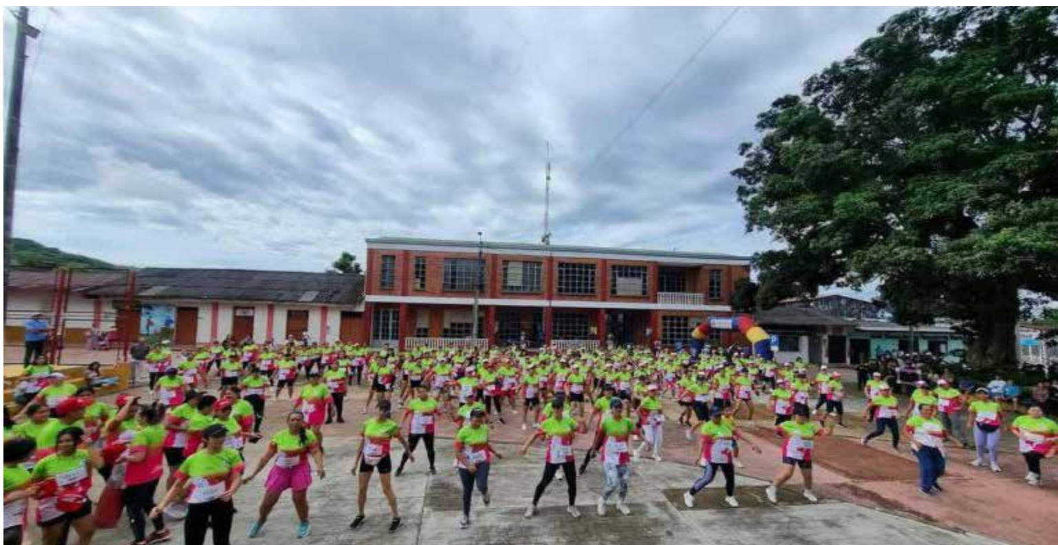
«Cundinamarca en Movimiento» tiene un objetivo claro: reducir la incidencia de enfermedades como la diabetes, hipertensión, obesidad, problemas cardiovasculares, ansiedad y depresión

El Gobierno Departamental de Cundinamarca reafirma así su compromiso con el bienestar integral de sus habitantes, generando alternativas que promuevan una vida más sana y activa para todos.