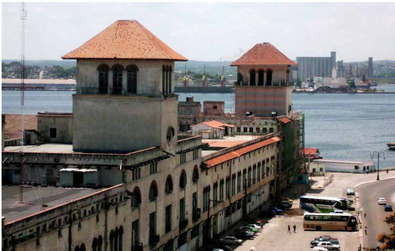
Es un paisaje verdaderamente placentero.

das. Un ambiente productivo se apreciaba en el moderno puerto pesquero de la Habana.