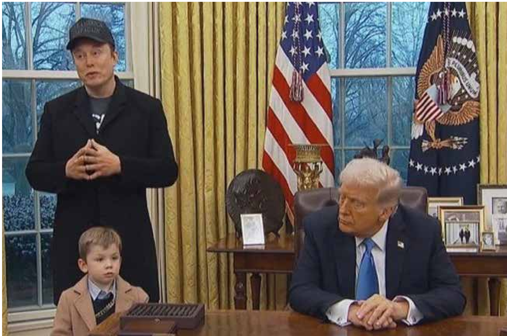
Elon Musk abandona el Gobierno de Trump «decepcionado»

E l magnate Elon Musk ha confirmado su salida de la administración de Donald Trump, marcando el fin de un turbulento período en el que lideró el controvertido Departamento de Eficiencia Gubernamental (DOGE). Su partida, aunque esperada, se produce en medio de crecientes tensiones y un desacuerdo público con las políticas económicas del presidente.