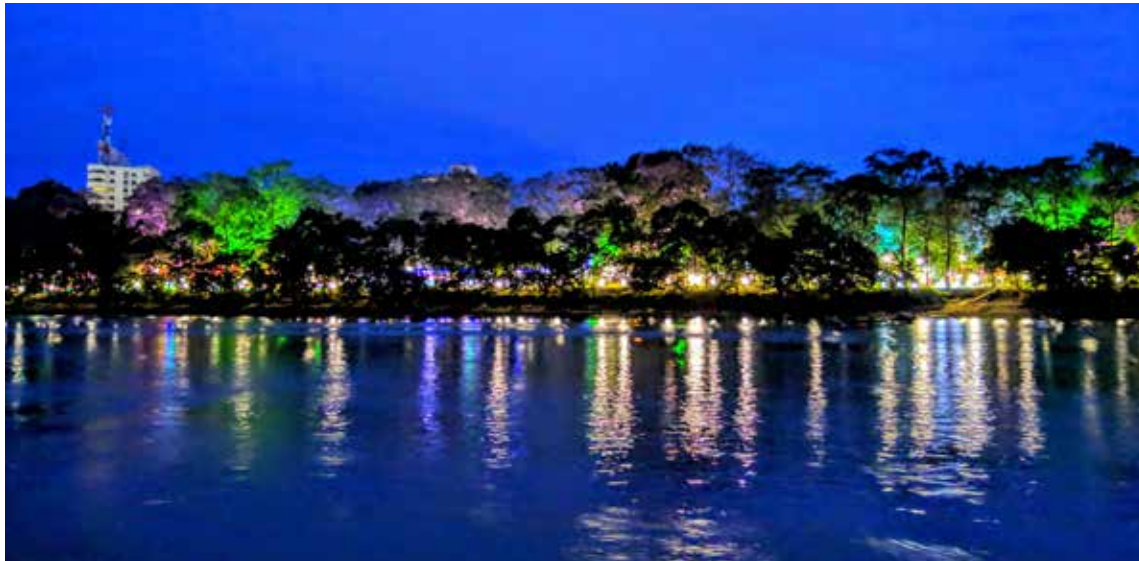
El río Sinú, la muralla de agua para Montería

En la ronda del Sinú, una avenida ecológica a orillas del majestuoso Río Sinú. El largo malecón lleno de grandes árboles, jardines con una multiplicidad de flores, ciclovía y lugares de comida, es de obligada visita. Las últimas alcaldías han mejorado el malecón