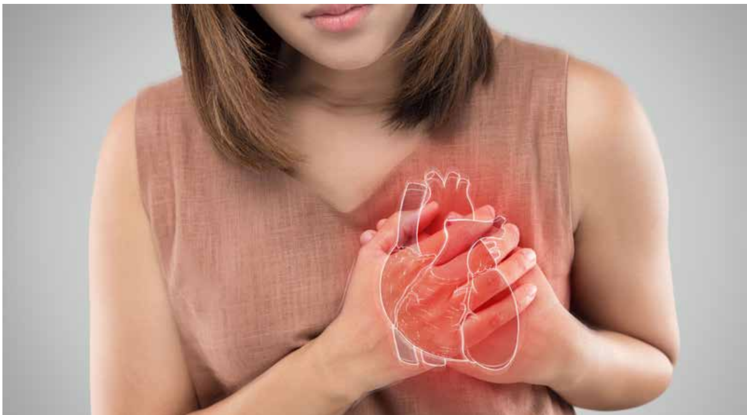
Las mujeres tienen un 18% más de riesgo de morir de infarto agudo de miocardio

En el 2015, las previsiones del Proyecto Global Burden of Disease (Carga Mundial de la Enfermedad) de las Naciones Unidas lo anticiparon: en los próximos 10 años el número muertes prematuras causadas por las enfermedades cardiovasculares en el mundo pasará de 5,9 millones en 2013 a 7,8 millones en 2025.