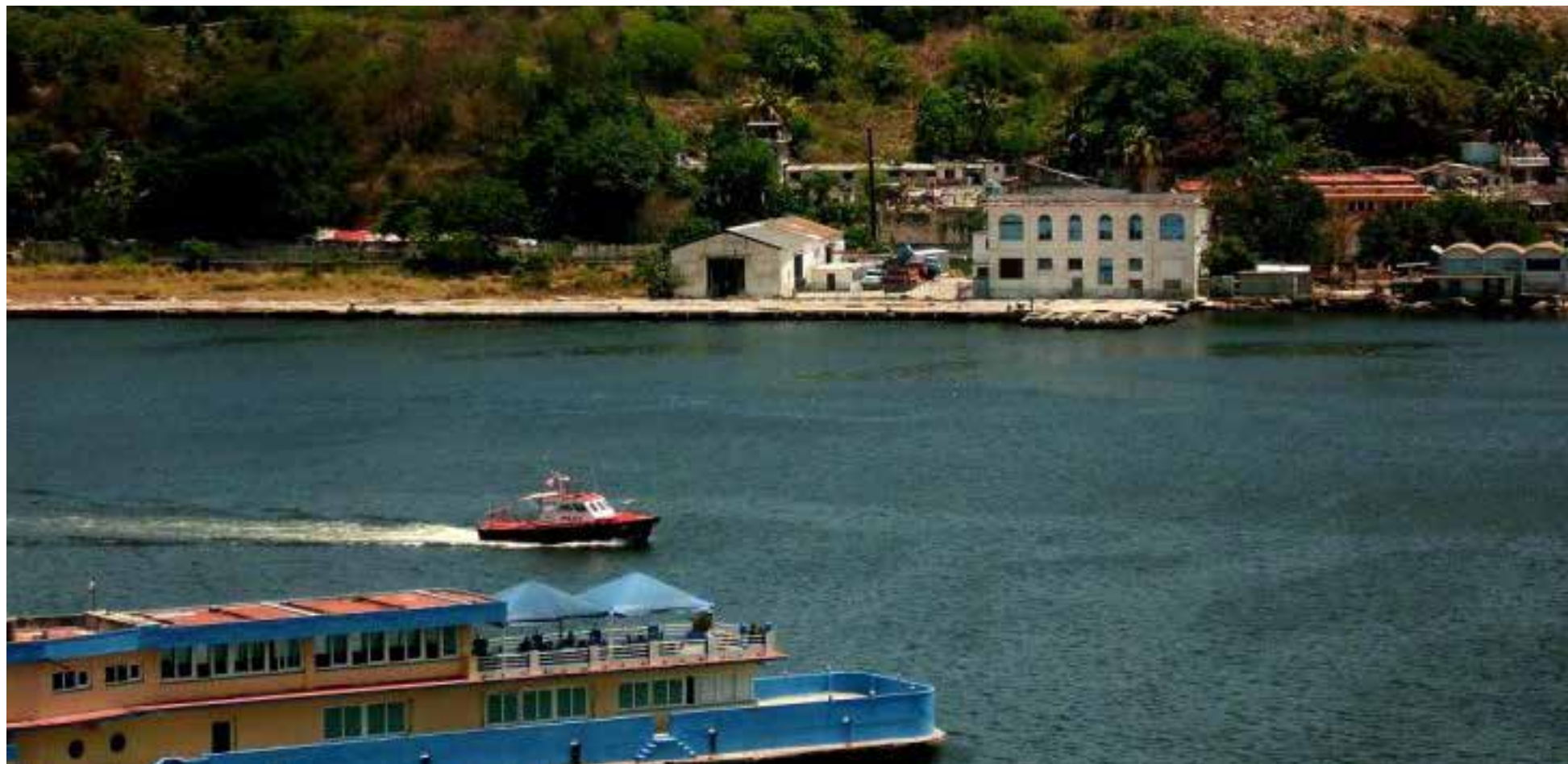
Bahía de La Habana considerada una de las más grandes y seguras de América y el Mundo.

Lázaro David Najarro Pujol Fotos autor y archivo