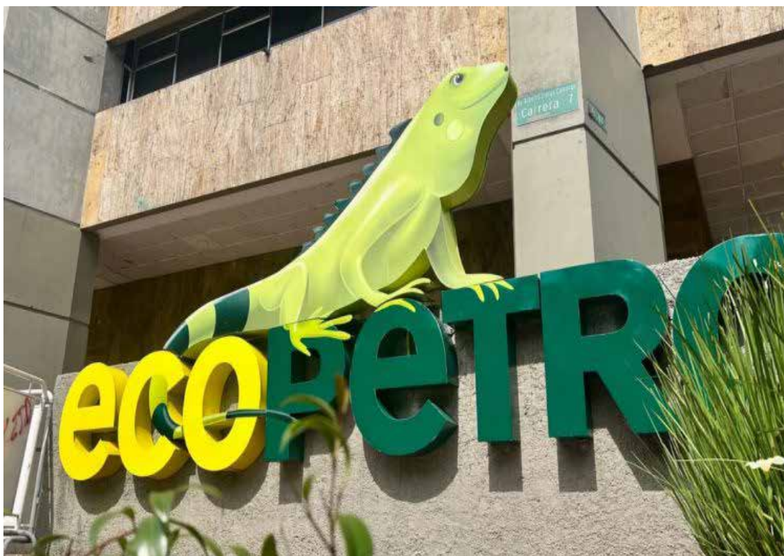
La Procuraduría General de la Nación ha puesto la lupa sobre Ecopetrol

Pero la controversia no termina ahí. Versiones de prensa sugieren que el contrato podría haber estado vinculado a un presunto proceso de retención y preservación de comunicaciones e información digital que habría afectado a directivos de la propia Ecopetrol,